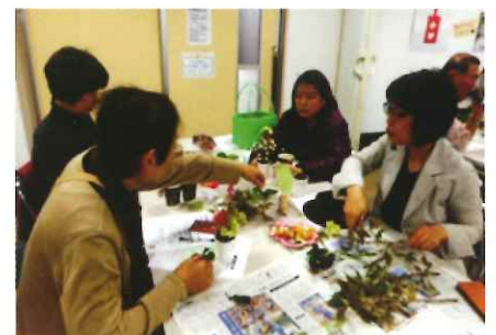
春の花を生けました