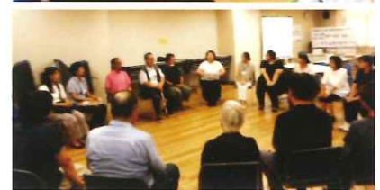
8月のカフェはピアサポート研修会を行いました